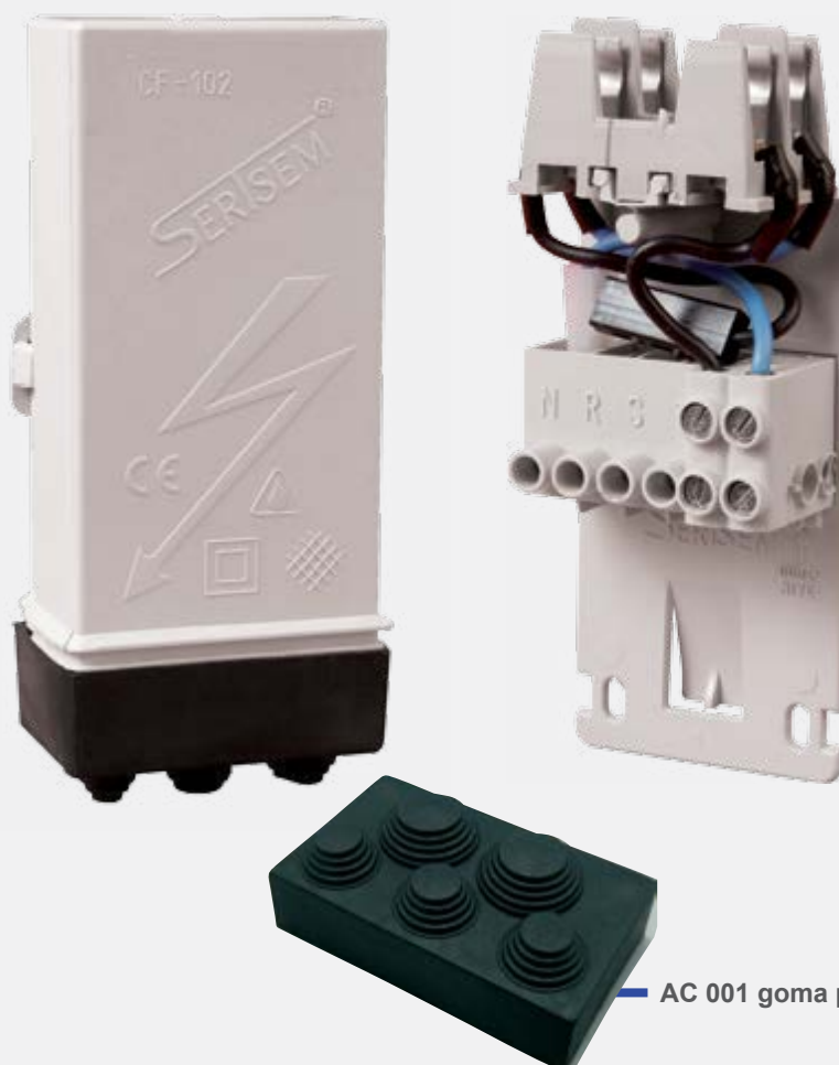
AC 001 goma premsaestopes.