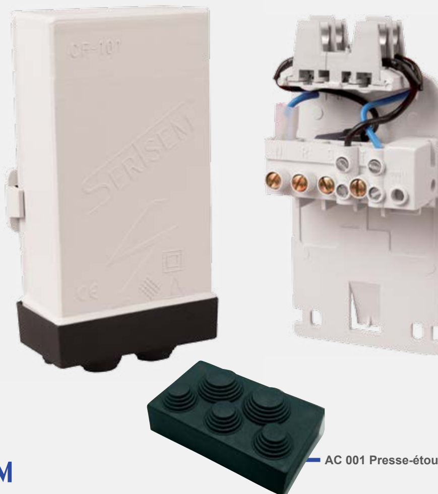
AC 001 Presse-étoupe en caoutchouc