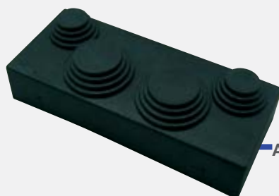
AC 001 Goma prensaestopas.