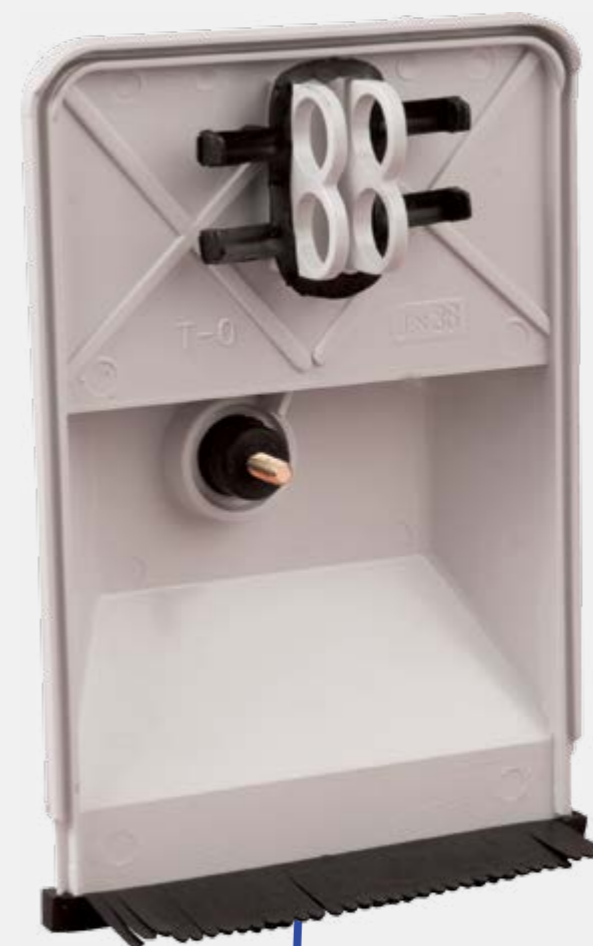
AC 002 goma serrell

REPARTIMENT DE CÀRREGUES ENTRE FASES, AMPLITUD DIMENSIONAL, FACILITAT I RAPIDESAD'INSTAL·LACIÓ I MANTENIMENT, GRAN QUALITAT D'INSTAL·LACIÓ.